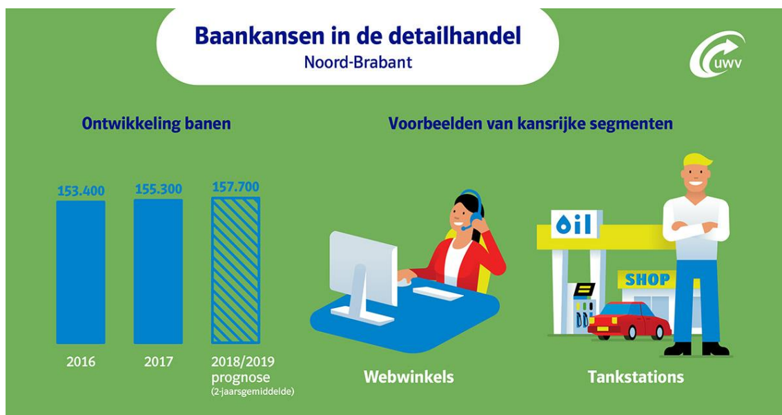
Afbeelding 2: Baankansen detailhandel Noord-Brabant

Er ontstaan vooral kansen in webwinkels, bouwmarkten, woonwinkels, supermarkten en tankstations. Er worden echter wel steeds hogere eisen gesteld aan verkooppersoneel, omdat in fysieke winkels de klantbeleving steeds meer centraal komt te staan. Klantgericht werken en vak- en productkennis zijn onontbeerlijk. Vanwege toenemende technologische toepassingen (bijvoorbeeld zogenaamde 'slimme kassa's') zijn ook digitale vaardigheden steeds belangrijker.